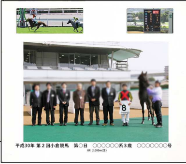
平成30年 第2回小倉競馬 第○日 ○○○○○系3歳 ○○○○○号 ※2,000mm