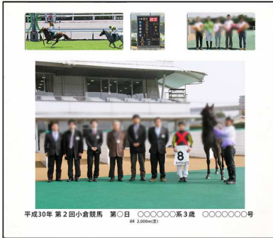
平成30年 第2回小倉競馬 第○日 ○○○○○系3歳 ○○○○○号 ※2,000mm